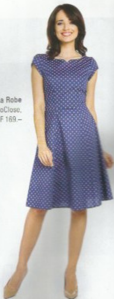
2. Robe en coton, La Robe Boutique RosaBelle & SoClose, CHF 169.-