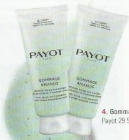
4. Gommage amande Payot 29.50.-

NOS ADRESSES SHOPPING: 1. Boutique Manidou, Galerie St-François B, Lausanne (079 257 34 87) / www.manidou.com . 2. RosaBelle & SoClose, 2b, Avenue de la Gare, Lausanne (021 525 66 11) / www.rosabelleandsoclose.ch . 3. Cuisinart, www.cuisinart-suisse.ch / www.facebook.com/CuisinartSuisse . 4. Institut de beauté Vio Malherbe, rue de Bourg 11, 1003 Lausanne (021 312 38 01) / www.viomalherbe.ch . 5. Pirkko, place Benjamin Constant 2, Lausanne (021 323 12 31) / www.nospirkko.com .