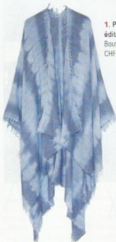
1. Poncho Cactus édition limitée, Manidou Boutique Manidou, CHF 260.-