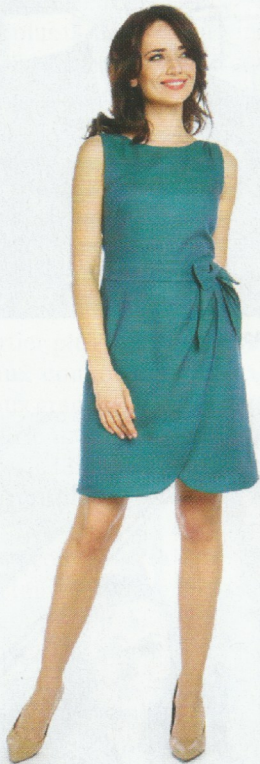
1. Robe en coton, La Robe Boutique RosaBelle & SoClose, CHF 169.–

Des éléphants dans le jardin Meral Kureyshi Ed. de l'Aire, 2017 – 179 pp.