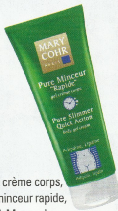
3. Gel crème corps, pure minceur rapide, 200 ml, Mary coh Vio Malherbe, CHF 67.–