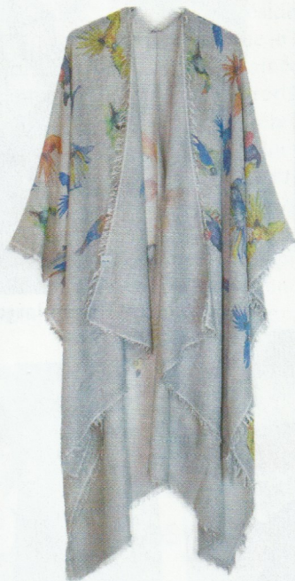
2. Poncho Papagallo - édition limitée, Manidou Boutique Manidou, CHF 260.–