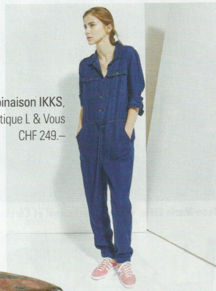
4. Combinaison IKKS, Boutique L & Vous CHF 249.–