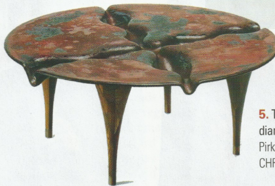
5. Table artisanale en verre, diamètre 97 cm Pirkko - Architecture d'intérieur, CHF 2'900.–

NOS ADRESSES SHOPPING: 1. RosaBelle & SoClose, 2b, Avenue de la Gare, Lausanne (021 525 66 11) / www.rosabelleandsoclose.ch . 2. Boutique Manidou, Galerie St-François B, Lausanne (079 257 34 87) / www.manidou.com . 3. Institut de beauté Vio Malherbe, rue de Bourg 11, 1003 Lausanne (021 312 38 01) / www.viomalherbe.ch . 4. L & Vous, rue de Lausanne 12, Vevey (021 921 66 23) / www.l-et-vous.ch . 5. Pirkko, place Benjamin Constant 2, Lausanne (021 323 12 31) / www.newpirkko.com .